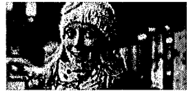
Frida Lagerholm, 33 år, Södermalm:

–Både fonder och bankkonto. Vi testar lite och stämmer av varje månad.