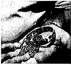
Guldpriset på hög nivå.